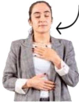
Poważne trudności z oddychaniem.