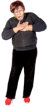
Objawy zawału serca.