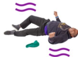
Napady i drgawki.