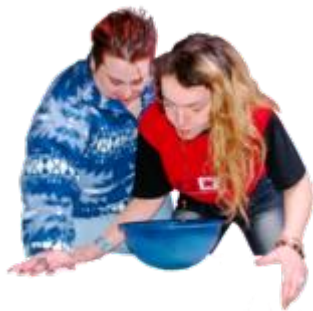
ਪੇਟ ਦਰਦ, ਉਲਟੀ ਮਹਿਸੂਸ ਹੋਣਾ ਅਤੇ ਪੇਟ ਖਰਾਬ ਹੋਣਾ