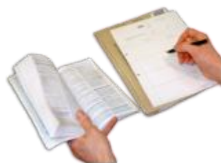
ਜੇਕਰ ਤੁਹਾਨੂੰ ਦਵਾਈ ਦੀ ਪਰਚੀ ਦੀ ਲੋੜ ਹੈ