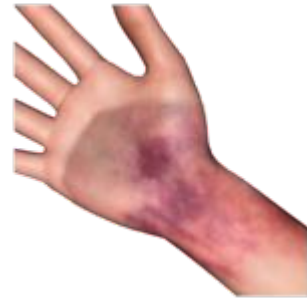
ਸੱਟਾਂ ਜਿਵੇ ਕਿ ਚੀਰਾਂ ਜਾਂ ਨੀਲ