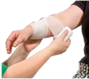
ਖਿਚਾਅ ਅਤੇ ਮੋਚ