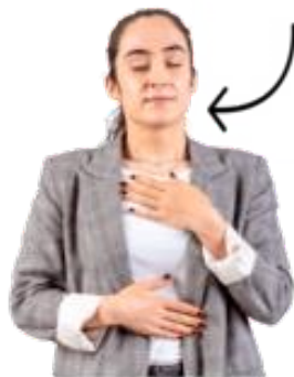
ਸਾਹ ਲੈਣ ਵਿੱਚ ਗੰਭੀਰ ਮੁਸ਼ਕਲ