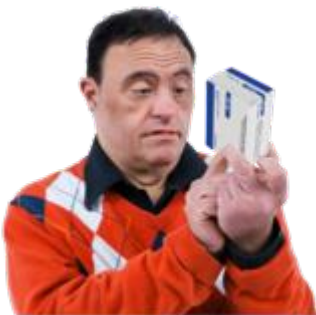
ਖੁਦਕੁਸ਼ੀ ਦੀ ਕੇਸ਼ਿਸ਼