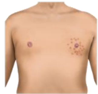
ਚਮੜੀ ਦਾ ਇਨਫੈਕਸ਼ਨ ਅਤੇ ਧੱਫੜ