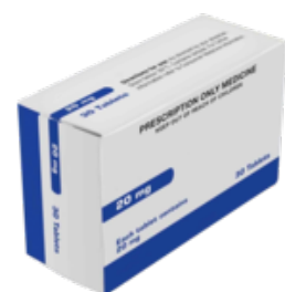
ਐਮਰਜੈਂਸੀ ਗਰਭ ਨਿਰੋਧ