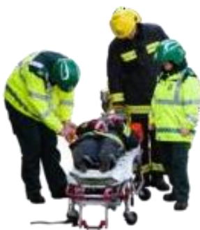
Leziuni grave sau umflături apărute brusc.