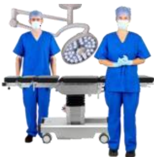
Săli de operații pentru intervențiile de urgență, operații programate și nașteri.