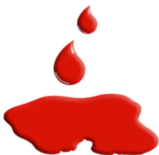
Pierdere excesivă de sânge. Excesivă înseamnă în cantitate mare.