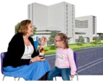
Secție UPU de pediatrie, cu unitate de evaluare pediatrică.