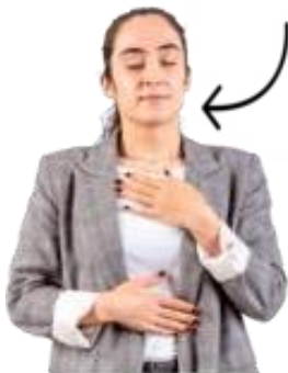
Dificultăți severe de respirație.