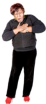
Semne de infarct.