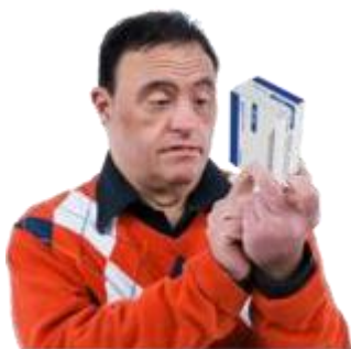
Tentativă de sinucidere.