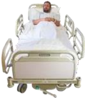
Saloane separate pentru adulți și copii, unele dotate cu baie proprie.