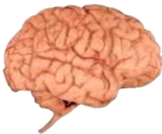
Semne de atac vascular cerebral.