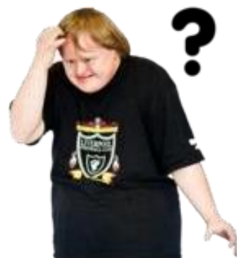
Stare bruscă de confuzie.