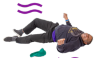
ਦੌਰੇ ਅਤੇ ਫਿੱਟ