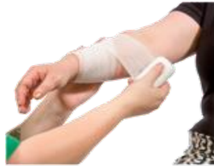
ਖਿਚਾਅ ਅਤੇ ਮੋਚ