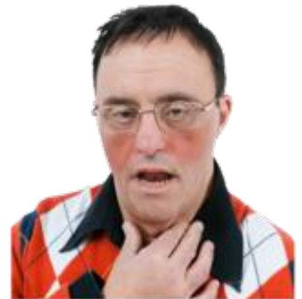
ਦੌਰੇ ਅਤੇ ਫਿੱਟ