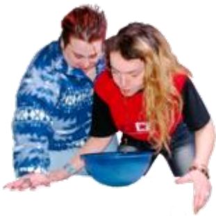
ਪੇਟ ਦਰਦ, ਉਲਟੀ ਮਹਿਸੂਸ ਹੋਣਾ ਅਤੇ ਪੇਟ ਖਰਾਬ ਹੋਣਾ